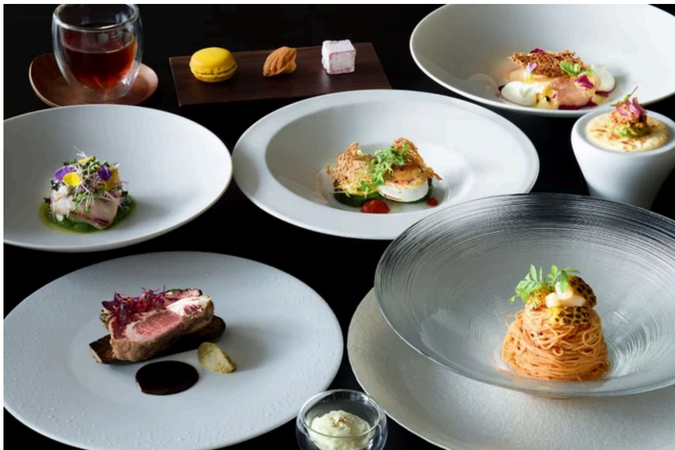
イタリアンディナーコース「Festa Italiana - Estate（夏） -」

冷製カッペリーニや胡瓜のガスパチョ、夏野菜ソテーを添えた仔羊のブラックパン粉焼きなど、地中海の夏を思わせるような彩り豊かなメニューをご用意。さらにディナーコースには、イカのリピエノと小菓子を加え、より華やかなサンセットディナーコースに仕上げました。ランチ・ディナーともに、メインディッシュを追加料金にて牛フィレ肉のロティにアップグレードすることも可能です。