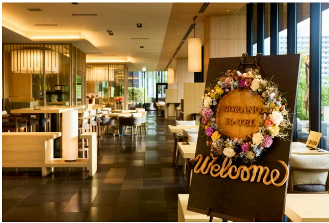
3つのセラーとオープンキッチンが彩るレストラン店内