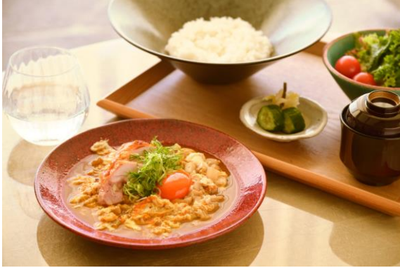
インルームダイニング