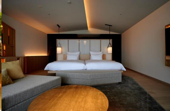
スタンダードルーム