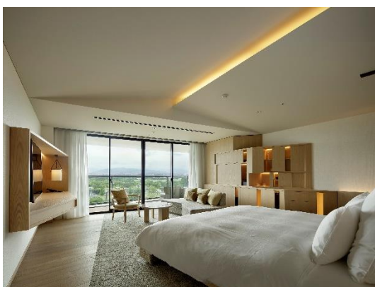
客室(スカイキング パークビュー)

*NATRUE 認証: 含まれる天然素材の 95%以上がオーガニック認定生産者由来で、3段階認証の最高ランク