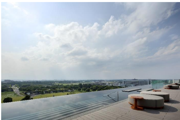
インフィニティプール

一人ひとりのコンディショニングに寄り添い、心身をリセットする施設やプログラムをご用意します。コンディショニングとは、現在のからだの状態から、理想の状態へと導くための行動や過程全てのプロセスで、からだが健康的なより良い状態を保ち続ける持続性を重視したトレーニングを行います。