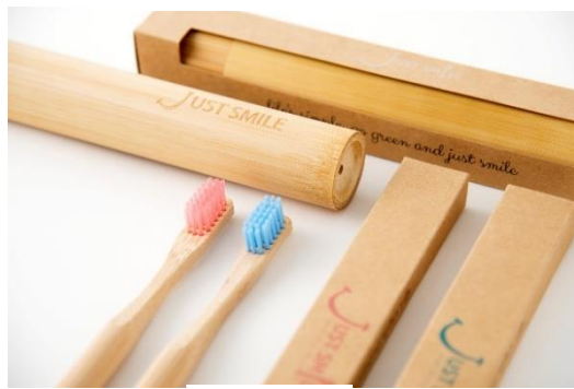
Just Smile 歯ブラシ