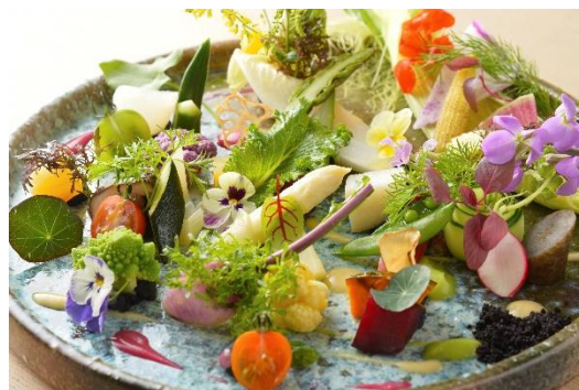
約50種の野菜・ハーブを用いた「DAICHINO SALAD」