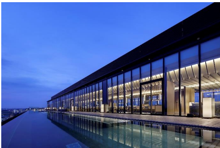
インフィニティプール

東京にありながら、これまで東京にはなかったタイプのホテルという位置づけで、緑豊かなエリアに、リゾート性溢れる施設や新しいダイニングのスタイルで、東京・立川に新たな旅のデスティネーションとなる宿泊需要の喚起を目指してまいります。