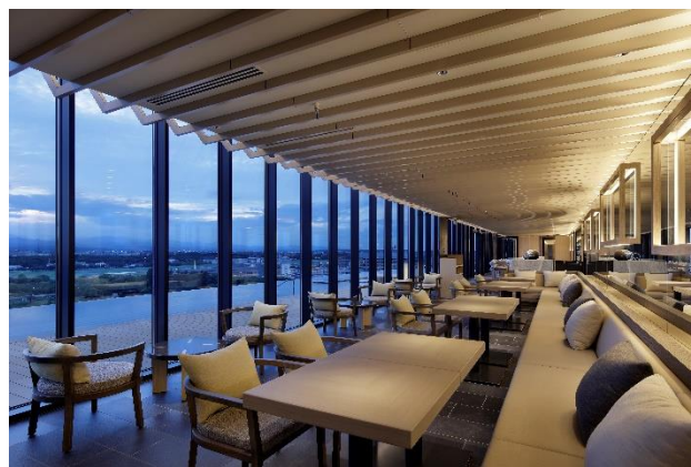
SORANO ROOFTOP BAR