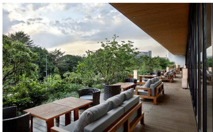
DAICHINO RESUTAUANT テラス席